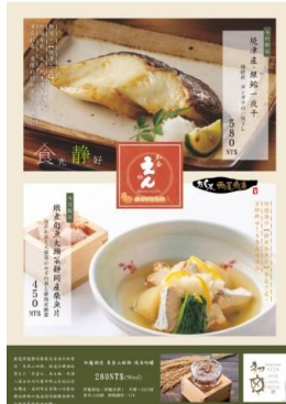
「和食えん」でのフェアMENU